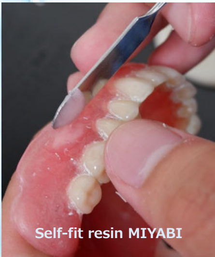
Self-fit resin MIYABI